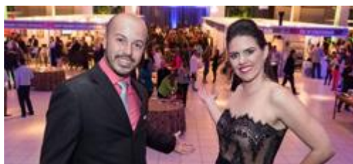
Jovens de Botucatu faturam R$ 3 milhões com rede para o interior

Sobre o Centro Paula Souza – Autarquia do Governo do Estado de São Paulo vinculada à Secretaria de Desenvolvimento Econômico, Ciência, Tecnologia e Inovação, o Centro Paula Souza administra as Faculdades de Tecnologia (Fatecs) e as Escolas Técnicas (Etecs) estaduais, além das classes descentralizadas – unidades que funcionam com um ou mais cursos técnicos, sob a supervisão de uma Etec –, em mais de 300 municípios paulistas. Nas Etecs, o número de matriculados nos Ensinos Médio, Técnico integrado ao Médio e no Ensino Técnico, para os setores Industrial, Agropecuário e de Serviços, ultrapassa 211 mil estudantes. As Fatecs atendem cerca de 80 mil alunos nos cursos de graduação tecnológica.