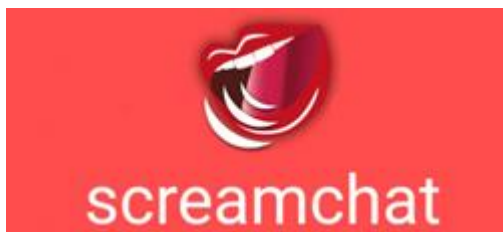
Estudante da Fatec Araçatuba desenvolve app de bate-papo