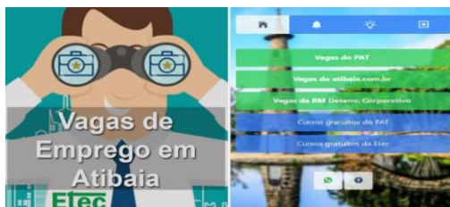
Etec de Atibaia lança app com vagas de emprego por meio de parcerias