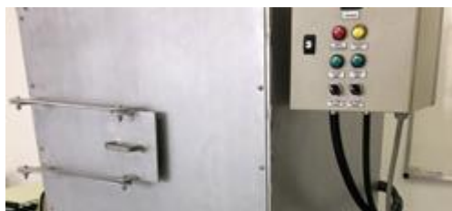
Fatec Osasco cria forno que utiliza resíduos de lama como matéria-prima