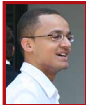
Raphael visitou os Estados Unidos por duas semanas

escrita em inglês, entrevista pessoal e análise socioeconômica.