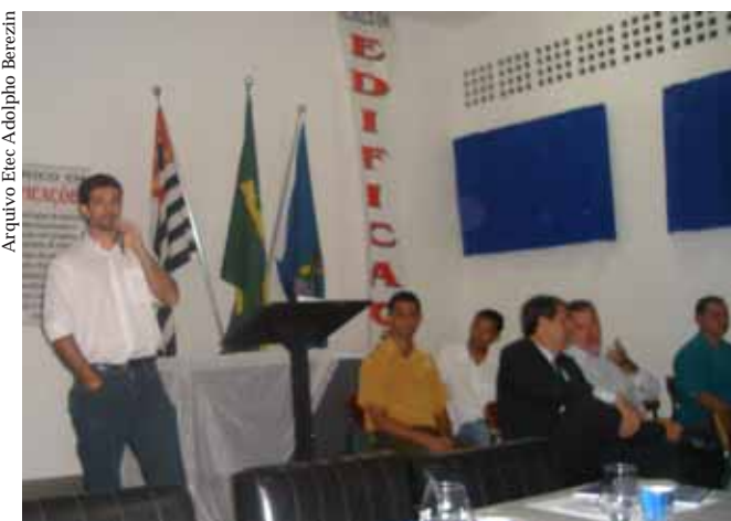
No encontro, alunos tiveram a chance de conhecer possíveis empregadores