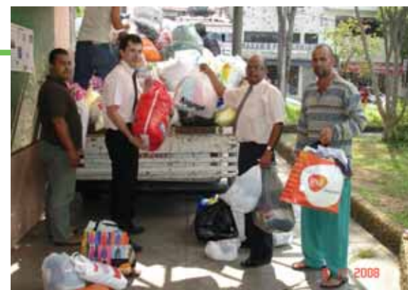
Etec de Diadema recebe doações

E a Etec Trajano Camargo (Limeira) ganhou o 1º lugar do Prêmio Construindo a Nação para Educação de Jovens e Adultos (EJA), promovido pelo Instituto Cidadania Brasil. O projeto intitulado "Desperte seu Potencial", oferece reforço escolar e atividades culturais a crianças carentes.