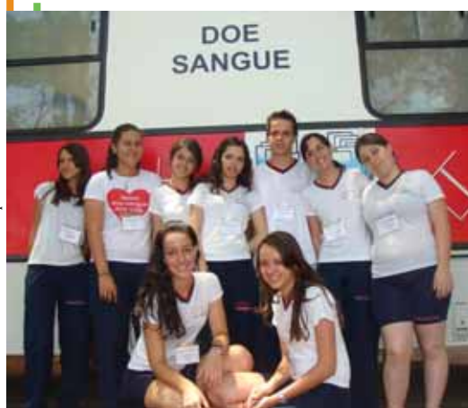
Alunos da Etec Pedro Ferreira Alves

Jornal Mural Manchetes Etecs – é uma publicação do Centro Estadual de Educação Tecnológica Paula Souza – Assessoria de Comunicação (AssCom): impressao@centropaulosouza.sp.gov.br – Jornalista responsável: Bárbara Abias – MTB 35.725 – Arte: Maria M. M. de Almeida – Tiragem: 2.500 exemplares – Impressão: MP Graf