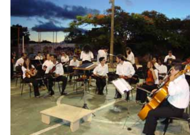
Orquestra populariza música erudita