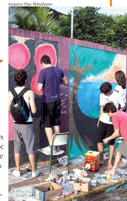
Pintura retrata a chegada dos tropeiros a Bebedouro