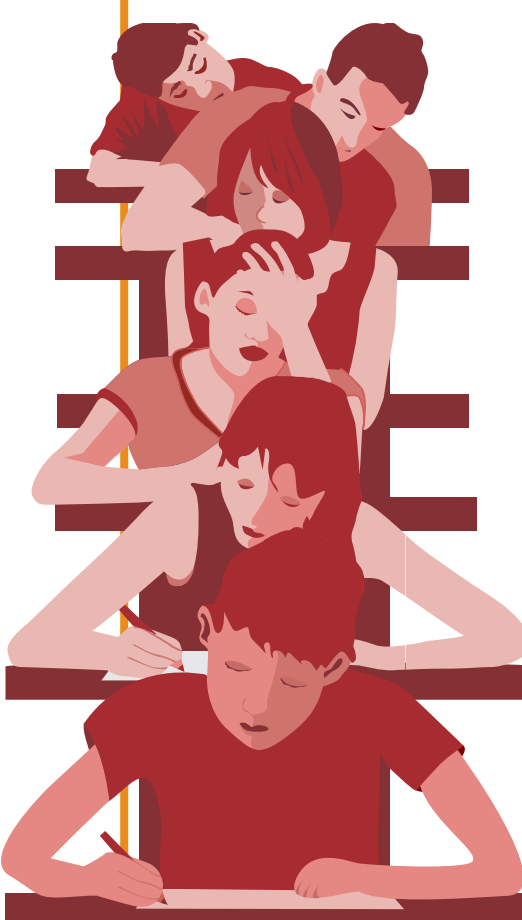
Ilustração: Rafaela Costa