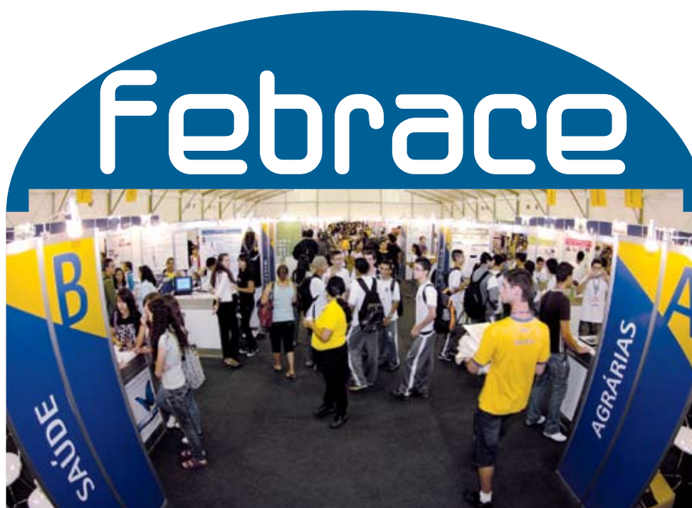
Mais de 12 mil visitantes participaram da 7ª edição, realizada em 2009

V inte projetos de onze Etecs estão na final da 8ª edição da Febrace (Feira Brasileira de Ciências e Engenharia, Criatividade e Inovação). Os projetos vão competir com trabalhos de alunos dos ensinos Fundamental, Médio e Técnico do Brasil inteiro. Para ver os finalistas das Etecs, acesse o site www.centropaulsouza.sp.gov.br . Os vencedores de cada categoria (são sete no total) ganharão uma viagem aos Estados Unidos para participar da Feira Internacional de Ciências