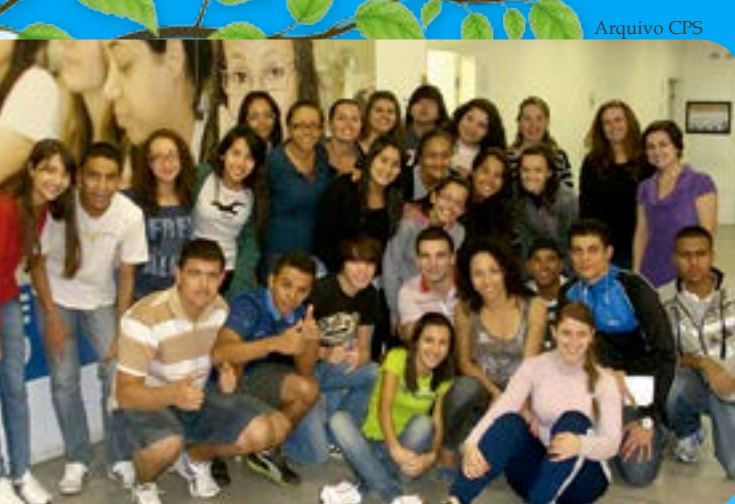
Comunidade acadêmica da USP debate trabalhos de estudantes de Heliópolis

Alunos do curso técnico de Administração da Etec Heliópolis (São Paulo) apresentaram cinco trabalhos sobre meio ambiente durante evento promovido pela Escola de Comunicação e Artes da Universidade de São Paulo (ECA-USP) e pelo Núcleo de Comunicação e Educação (NCE-USP) em junho. A atividade, que teve participação de 30 estudantes, aconteceu paralelamente à 3ª edição da Virada Sustentável. Em uma parceria entre empresas privadas, setor público e organizações civis, a iniciativa reuniu mais de 600 atrações culturais e recreativas ligadas à sustentabilidade na Capital e Região Metropolitana paulista.