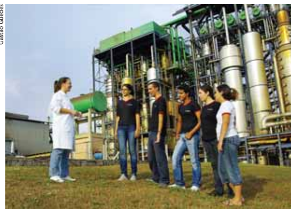
Alunos em usina de Araçatuba: uma das três Fatecs que oferecem o curso de Bioenergia Sucro-Alcooleira

Substituindo o curso de Processamento de Dados em São Paulo, surge o de Análise e Desenvolvimento de Sistemas (também oferecido em Presidente Prudente), o mais concorrido do último vestibular, com 22,8 candidatos por vaga para o período noturno e 17,7 para o matutino, ambos na capital paulista. ■